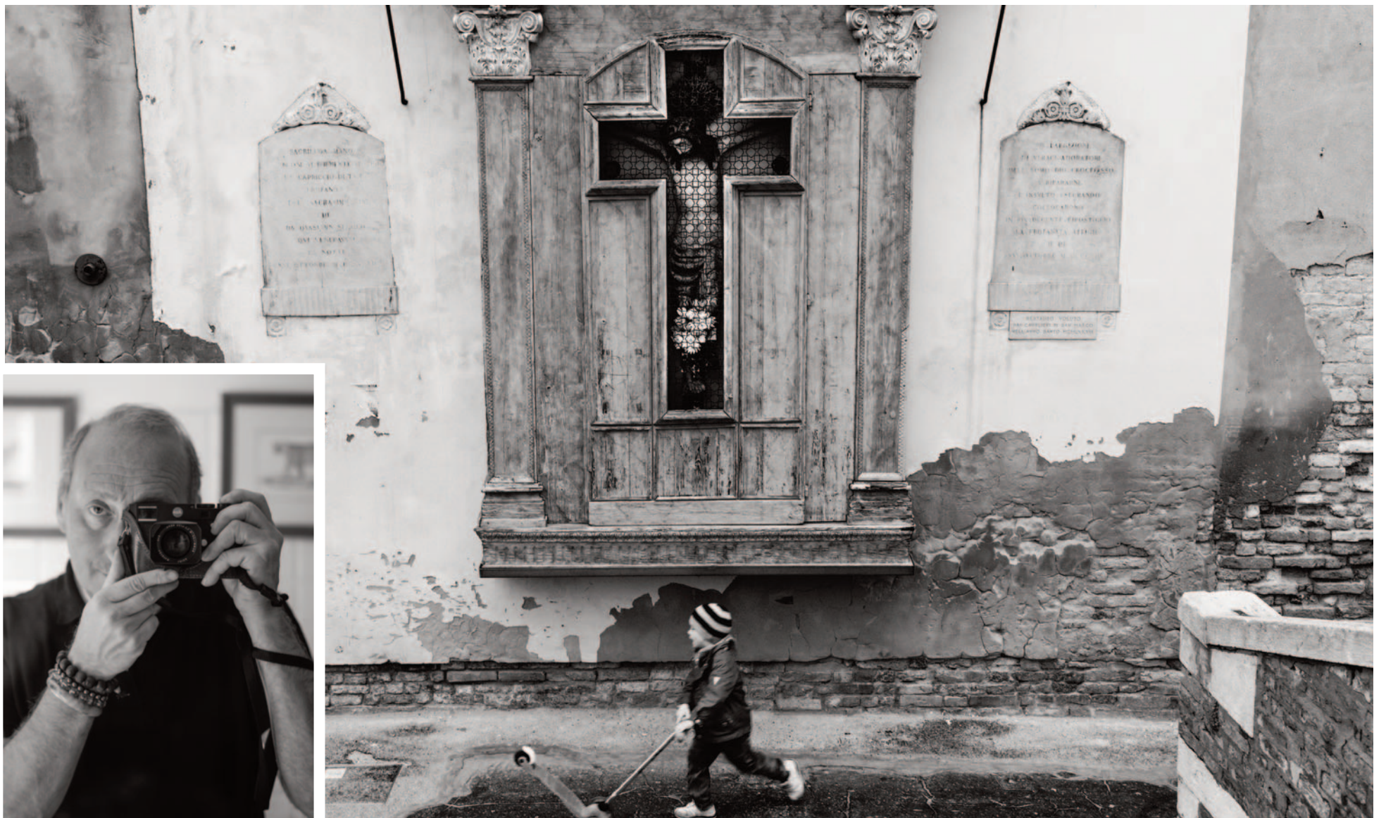
Venezia: la vita di ogni giorno. In basso a sinistra, il fotografo storyteller Marco Secchi

Detto questo, se dovessi pensare a un soggetto che mi piacerebbe fotografare, non sarebbe un luogo, una situazione o una persona specifica del passato. Sono i momenti inaspettati e ancora da scoprire che non vedo l'ora di catturare. La bellezza della fotografia sta nella sua capacità di sorprendere e sfidare il fotografo, e trovo grande gioia nella sua spontaneità e imprevedibilità. Voglio continuare a esplorare e catturare l'essenza della vita mentre si svolge intorno a me. Ogni nuovo giorno è un'opportunità per testimoniare e immortalare un momento speciale, ed è questa infinita possibilità che mantiene viva e fiorente la mia passione per la fotografia.