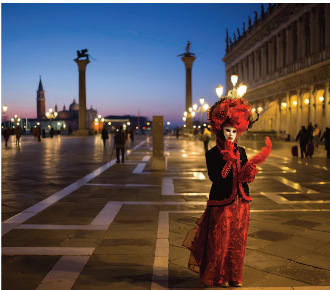
La magia del Carnevale a Venezia

Il mio amore per la fotografia è iniziato nelle trafficate strade di Milano, nel dinamico mondo della stampa e della fotografia di moda. Mentre crescevo, mio padre lavorava in uno dei più antichi negozi fotografici di Milano, un centro che soddisfaceva le esigenze creative dei fotografi tra la fine degli anni '60 e l'inizio degli anni '70. Questo ambiente unico mi ha fatto conoscere l'arte della fotografia in un'epoca in cui possedere una macchina fotografica era una rarità. Ricordo con affetto di aver ricevuto