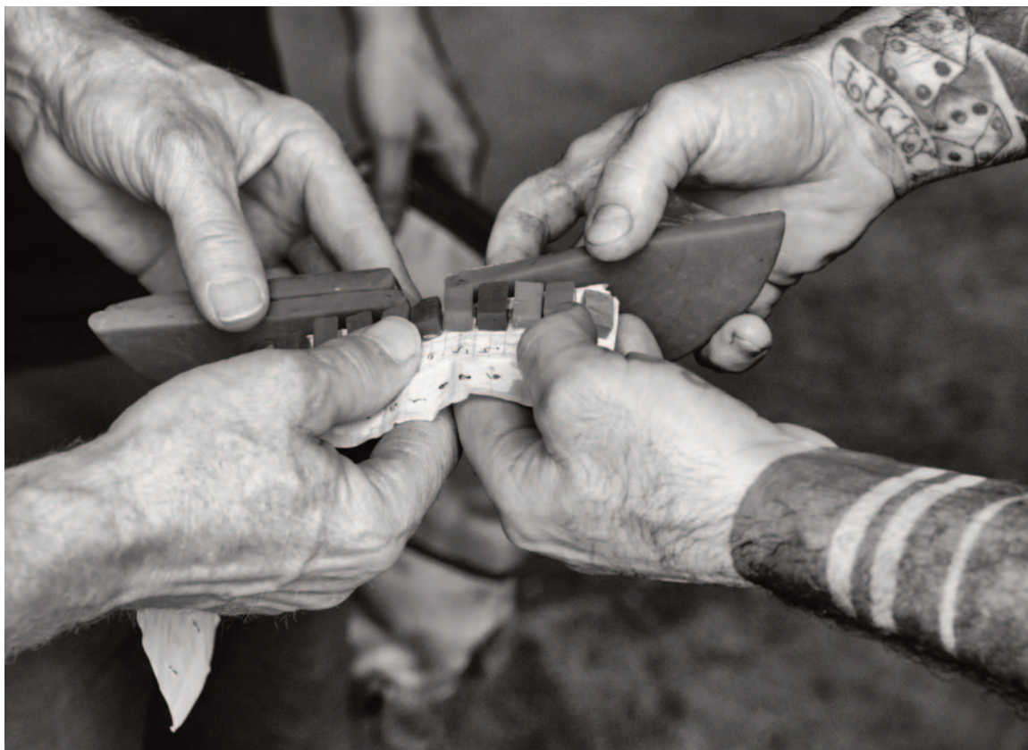
Le immagini di Marco Secchi sono più di fotografie, vogliono raccontare una storia

la mia prima macchina fotografica all'età di 9 o 10 anni. Per me non era affatto un giocattolo, era una porta verso un mondo di infinite possibilità. Con esso, diventando grande, ho scoperto le strade di Milano, la profondità delle espressioni umane, le storie non raccontate della vita quotidiana. Trasformare la fotografia in una professio-