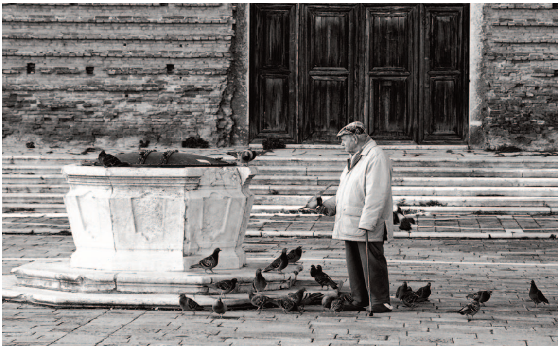
Life in Venice during the Carnevale and, below, a poetic moment in the everyday life of La Serenissima

about meeting the locals, no matter if they are artisans, shopkeepers, or passersby. All this is an important and invaluable part of all my workshops. My aim is, both with my photography and these workshops, to offer a narrative of the city that is both deeply personal and universal: I want people - those who see my work and those who come to my workshops - to see and appreciate the interplay of history, culture, and everyday life that makes Venice so extraordinary. I want them to create a connection with the city, to understand her, with all its complexities and beauties, on a more profound level.