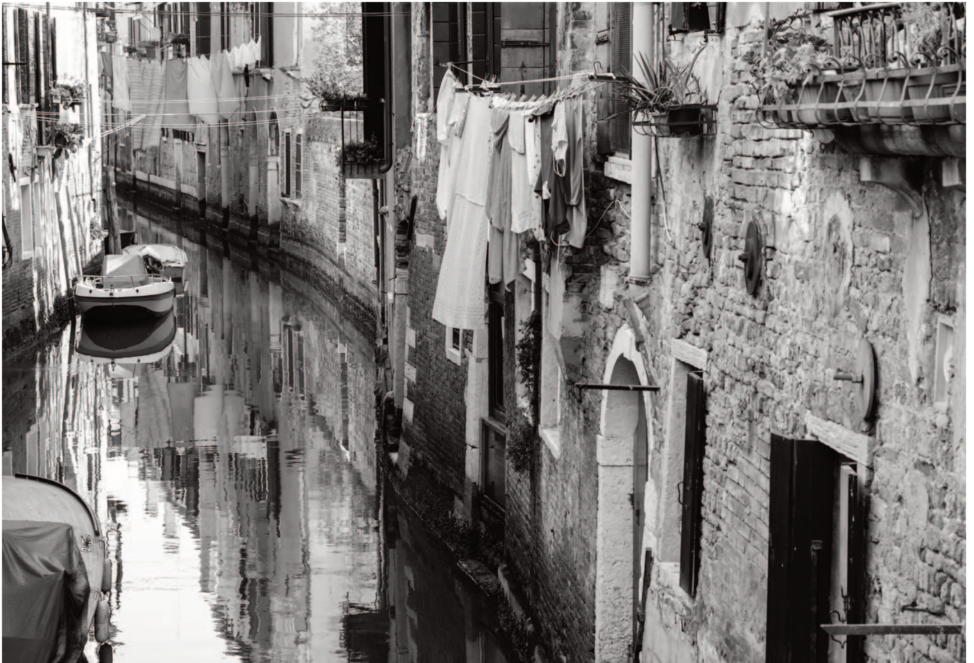
The real Venice, as seen through the eyes and camera of Marco Secchi